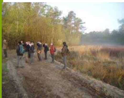
Marke Gorsselse heide

De Gorsselse heide was tot 2009 oefenterrein van het ministerie van Defensie. Het burgerinitiatief ontstond toen het Ministerie de grond wilde verkopen en er geluiden opkwamen dat er huizen zouden komen of dat het bedrijventerrein zou worden. Omwonenden wilden dat het toegankelijke natuur zou blijven en stelden voor het gebied zelf te gaan beheren, met bijval van de burgemeester. Het burgerinitiatief ging bijna ten onder door ambtelijke procedures. Een subsidie om de verzuring en verdroging aan te pakken werd stopgezet en rijk en provincie verschilden van mening wie hier verantwoordelijk voor was. Na de provinciale verkiezingen kwamen er andere politici. Uiteindelijk stelde de provincie na vier jaar subsidie beschikbaar. De burgers konden het gebied niet zelf betalen, daarom deed de Stichting IJssellandschap dat voor hen. Zeventig burgers beheren nu als vrijwilliger 115 ha natuur. ( www.markegorsselseheide.nl )