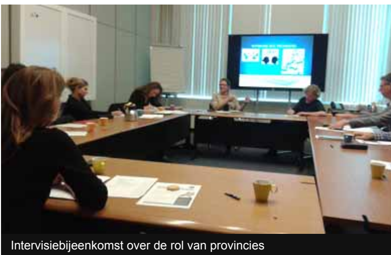
Intervisiebijeenkomst over de rol van provincies