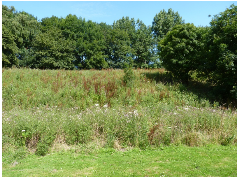
DB - Ander deel van hellinggrasland DB, plek met veel riet. Gemaaid in 2012.